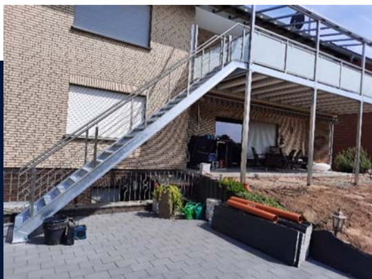
Treppe, Handlauf, Balkon und Vordach