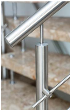
Edelstahlgeländer mit Stabfüllung