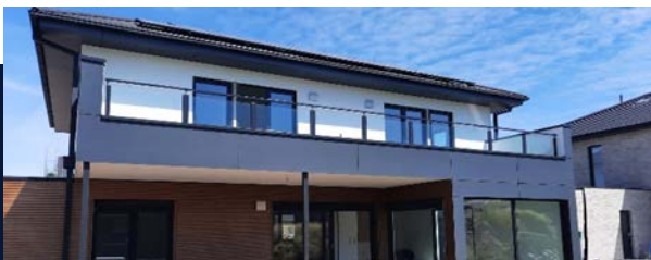
Balkongeländer mit Glaselementen

Egal ob Stahl, Edelstahl oder Aluminium, wir kennen uns aus.